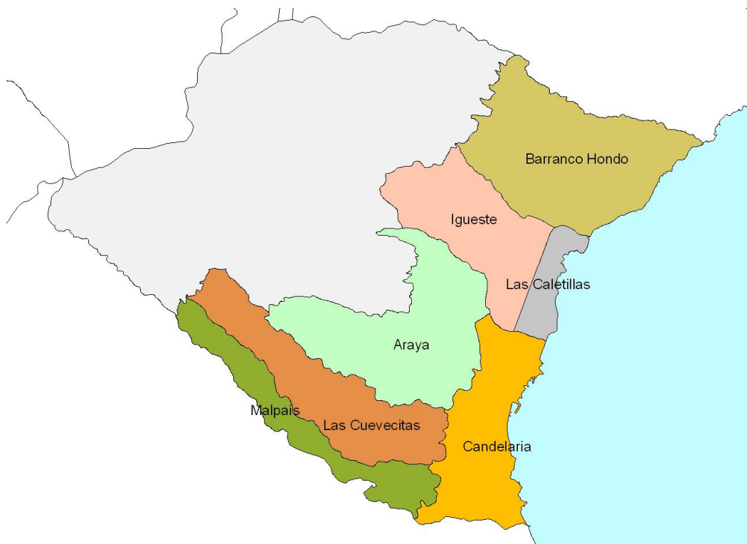
Ubicación de las entidades que forman el municipio

Candelaria se encuentra a 19 kilómetros de la capital Santa Cruz de Tenerife. Sus 25.924 habitantes se distribuyen entre las siete entidades de población que componen el municipio: Candelaria casco, Las Caletillas, Barranco Hondo, Igueste, Araya, Las Cuevecitas y Malpaís.