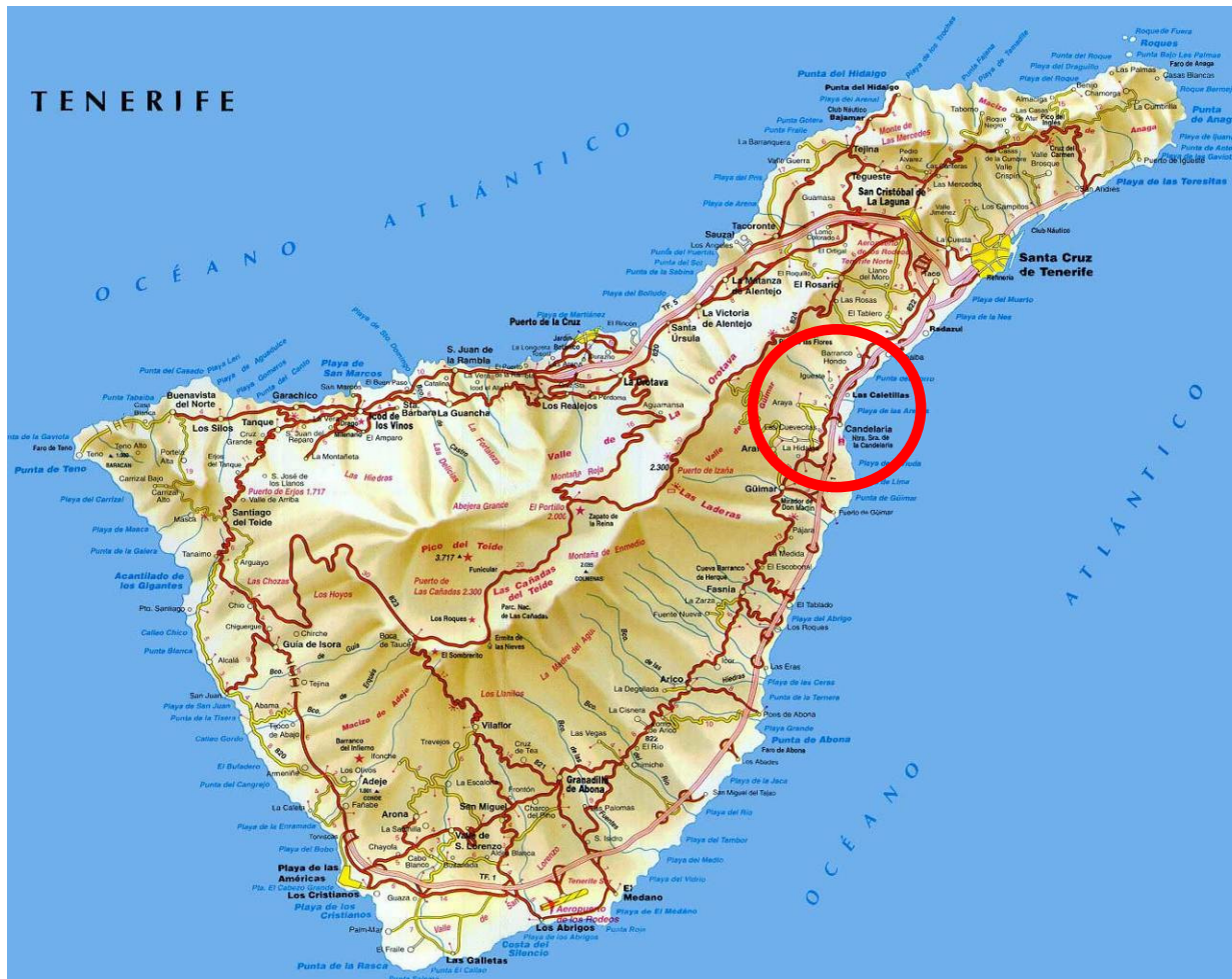
Ubicación de Candelaria en la isla de Tenerife

El municipio de Candelaria se haya enclavado en la vertiente meridional de la isla de Tenerife, en el denominado Valle de Güímar. La cordillera dorsal y la costa constituyen sus límites occidental y oriental. Al norte, el núcleo de Barranco Hondo le separa del municipio de El Rosario, mientras que al sur, linda con el municipio de Arafo en los Barrancos de Fuertes y de Tapia.