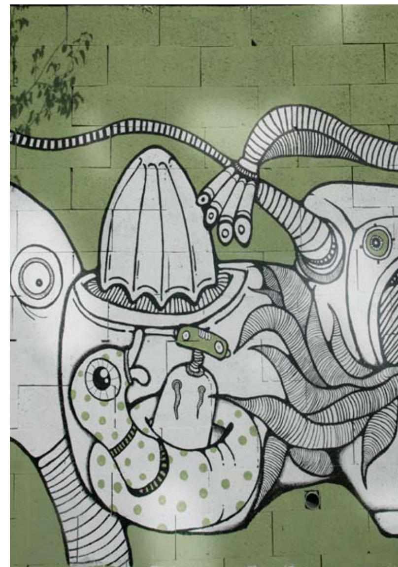
detalles de la pintura mural realizada en uno de los muros del interior del parque.