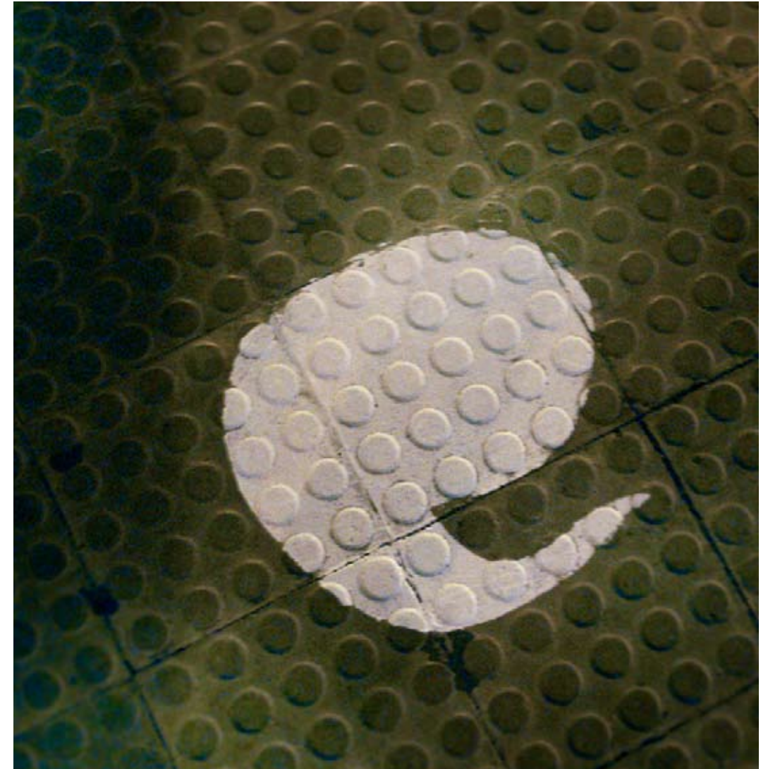
la aparición de lavadoras de colores en casco urbano de Benicassim fué acompañada por unos grafitis de pintura biodegradable representando la “E” del logo del eco-parc.