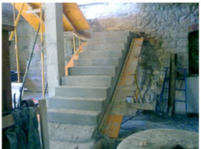
Escalera de ascenso a la planta superior