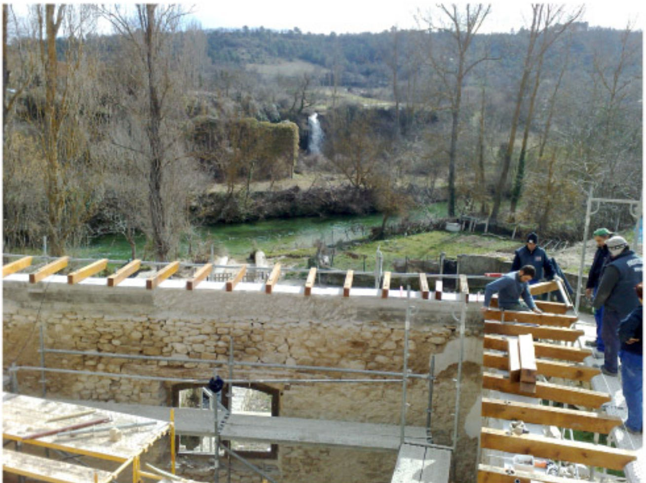
Montaje de los canecillos