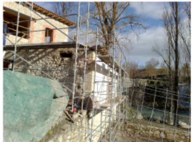
Montaje de andamios