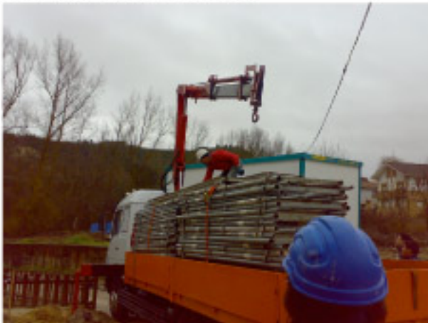
Montaje de andamios.