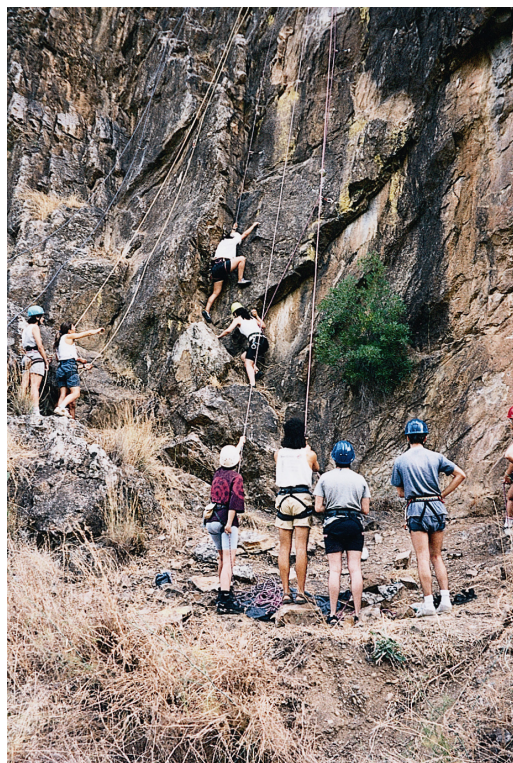
Peñón del Águila

Singularidades que hacen del Peñón del Águila un lugar idóneo para el inicio en la práctica de esta modalidad deportiva, así como para el mantenimiento y entrenamiento de escaladores más experimentados.