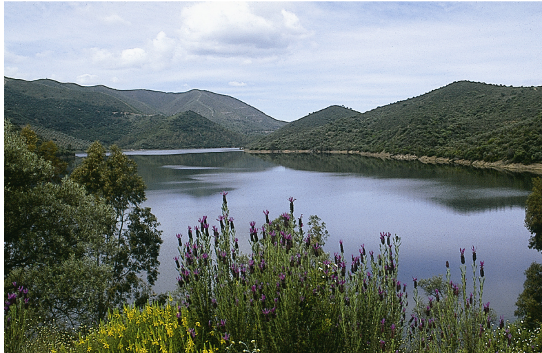
Embalse del Guadalmellato (Adamuz)