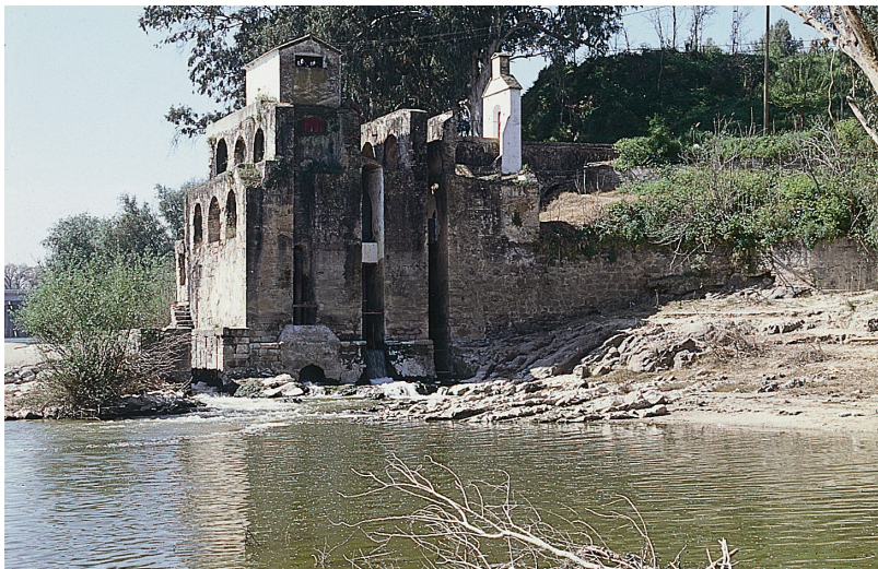
Las Grúas (El Carpio)