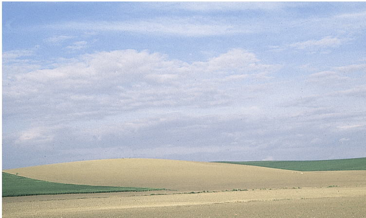
Campiña de Bujalance

significativo el verano. La temperatura asciende paulatinamente desde enero hasta julio, descendiendo luego con mayor rapidez a partir de este último mes. La distribución del tiempo entre las distintas estaciones es bastante equilibrada y sólo el verano se prolonga un mes más.