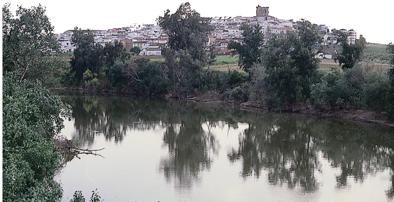
Río Guadalquivir a su paso por El Carpio

Además de los ríos Guadajoz y Genil, el Guadalquivir recibe en su margen izquierda numerosos arroyos, tanto en la zona de la sierra (Tamujoso, Arenosillo, Martín Gonzalo, Corcomé, Varas, Matapuecas, Guadalvacarejo, Benajafe, Zuheros, Mahoma...) como en la campiña (Palo Muerto, Asno, Zarzuela, Cañetejo, Salado, Guadatín, Calderitas, Gálvez, Galapagares, Álamo, Leonis, Temple, Picachos, Tamujar). Destacamos especialmente el de Cañetejo, que pasa por los términos de Cañete de las Torres, Bujalance y Villa del Río.