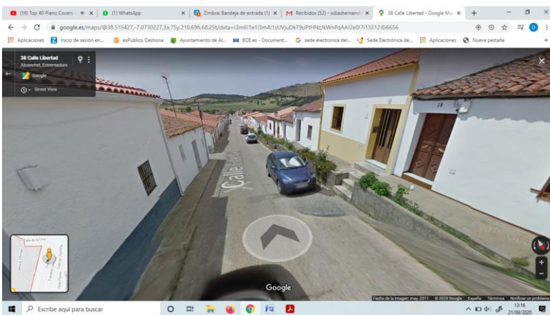
Encima 4 Imágenes de la Calle Libertad Estado en el que estaba.