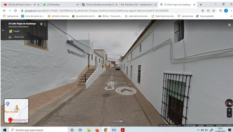
Encima Calle Virgen de Guadalupe. Estado en el que estaba.