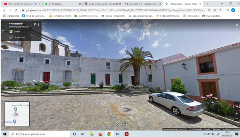
Encima Plaza de la Iglesia. Estado en el que estaba.