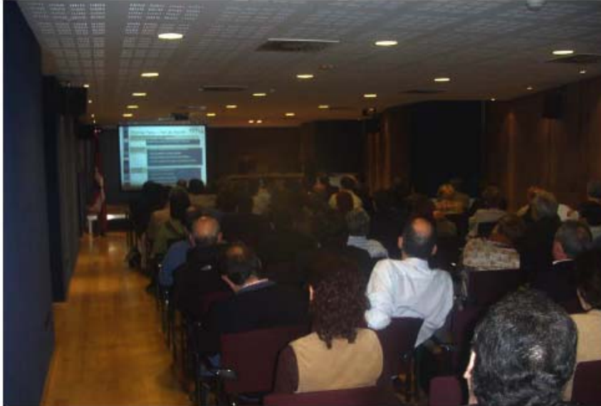
"Foro General de Participación Ciudadana de la Agenda 21 – Durango"