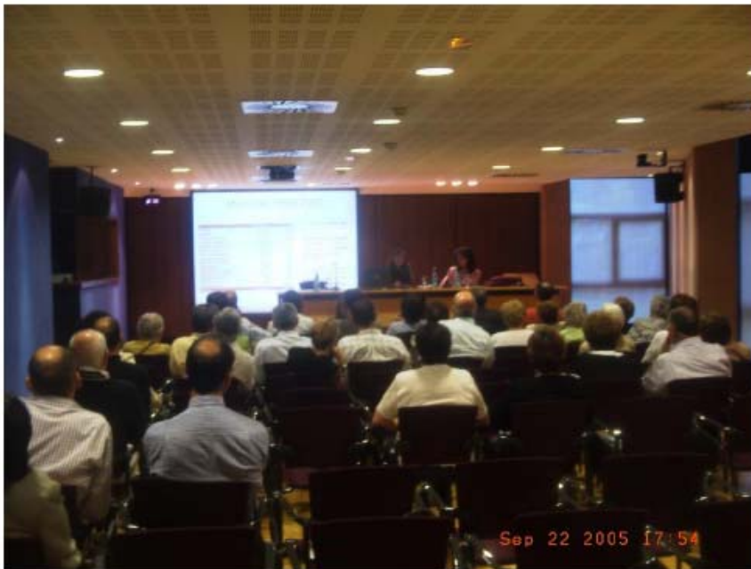
"Foro Temático sobre Movilidad Sostenible"